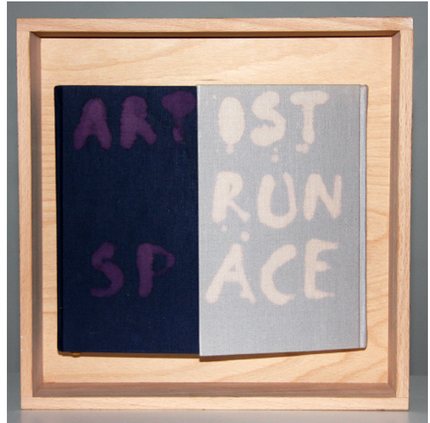
Frédéric Vincent, 2013, Artist-Run Space, book, wood and bleach, 40 x 50 cm